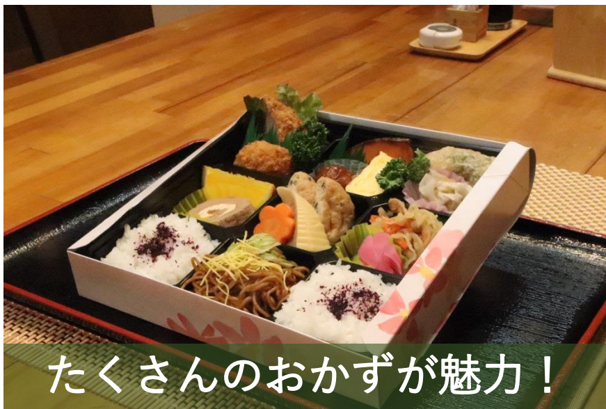
たくさんのおかずが魅力！