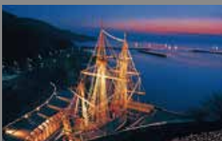
【サンファン館】 車で約20分