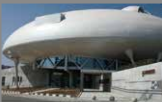
【石ノ森萬画館】 車で約5分