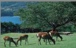
【金華山】 奥州三霊場