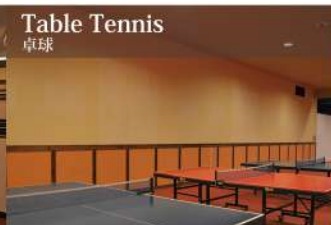
Table Tennis 卓球