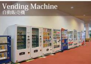
Vending Machine 自動販売機