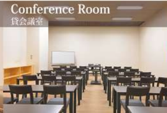
Conference Room 貸会議室